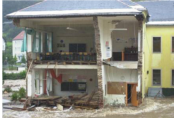
Abb. 3: Die zerstörte Grundschule von Schmiedeberg

Im Mittleren Erzgebirge wurde aus Vorsichtsmaßnahmen bereits am Abend des 11. August in den für Dresden wichtigen Talsperren Lehmühl, Klingenberg und Malter Wasser abgelassen. Doch der freie Stauraum reichte bei weitem nicht aus. Die Wassermassen konnten ungehindert talwärts fließen, dabei zahlreiche Gebäude zerstören (Abb. 3) und sich schließlich mit den Fluten der reißenden Weißeritz vereinen, die direkt in die Hochwasser führende Elbe mündet.