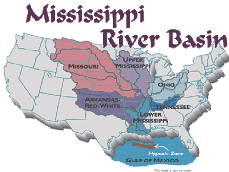
Abb. 1: Das Einzugsgebiet des Mississippi